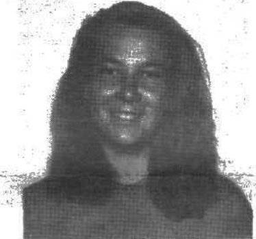
любимый писатель — Ф. Достоевский, и еще я люблю Лермонтова.

Во первых, наши перспективы связаны с теми договорами, которые заключает наш университет с другими странами. Эти договоры открывают возможности для обмена студентами и преподавателями. Второе направление, в котором мы должны развиваться и которое пока не осуществляется, — это прием коммерческих групп на валютной основе, то есть всех тех, кто желает учиться русскому языку за доллары, марки, франки и т. д. А что будет означать валюта для университета, я думаю, не надо много объяснять. Это и новая техника, и укрепление материальной базы, и доллары на билеты для студентов и преподавателей, уезжающих за рубеж. Не надо забывать, что деловые люди в западном мире знают, на что тратят деньги, и если они хоть один раз поймут, что приехали сюда зря — они больше сюда не приедут, то есть, другими словами, — надо принимать на соответствующем уровне.