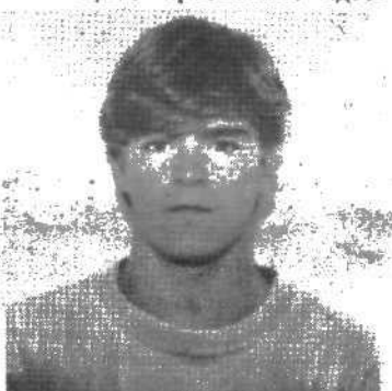
помогает вам преодолеть стереотипы и представления о нашей стране, которые сформировались у вас в Америке?

— Я представлял себе жизнь здесь в очень черных красках, а приехав, увидел, что хотя жизнь здесь очень трудная, но люди здесь хорошие, приветливые. У нас, к примеру, люди более холодны по отношению друг к другу и думают только о себе, а здесь они более отзывчивы, неравнодушны, несмотря ни на что. И я считаю, что это правильно: когда жизнь так