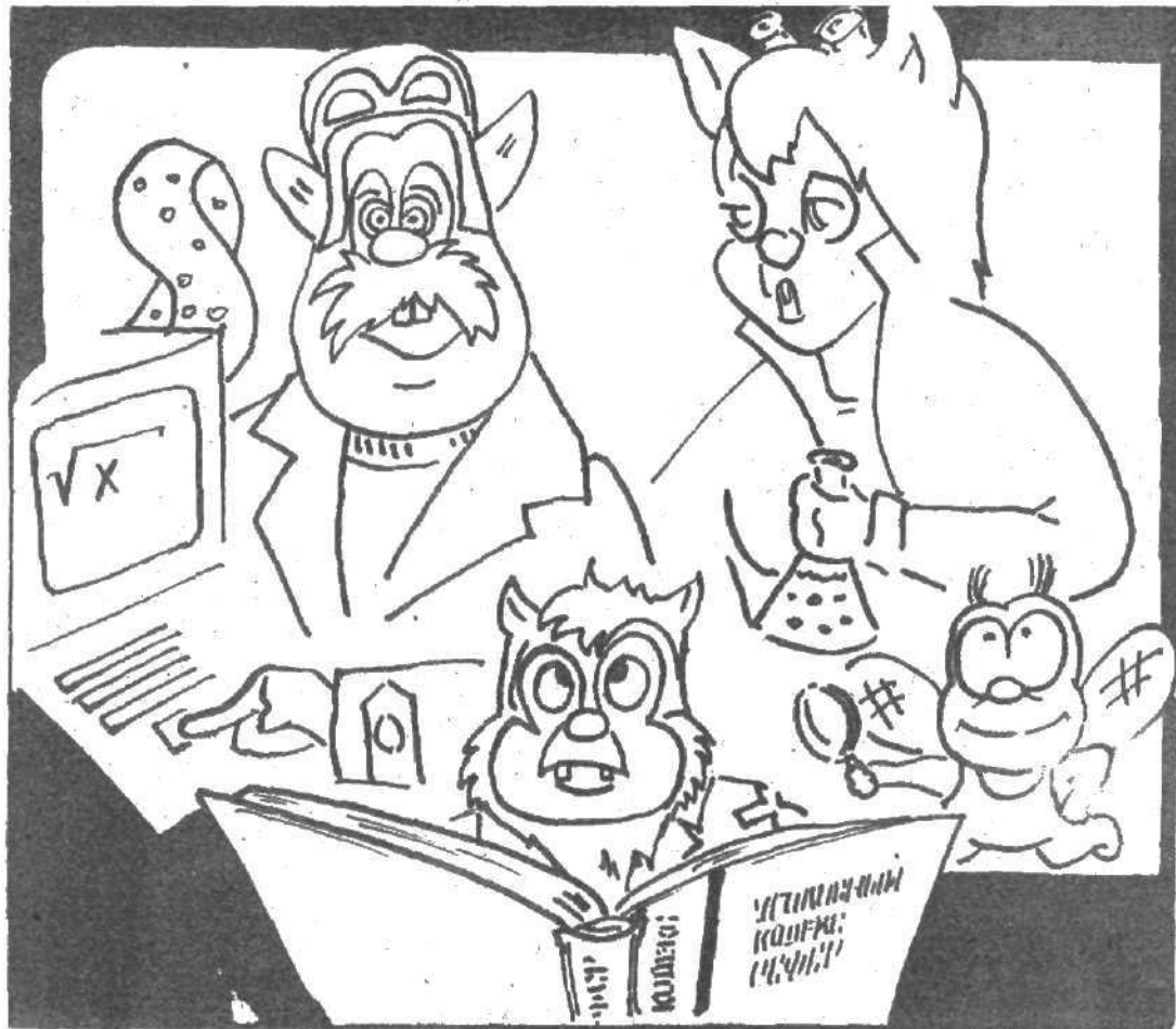
РЕБЯТА, ГРЫЗИТЕ НАУКУ...