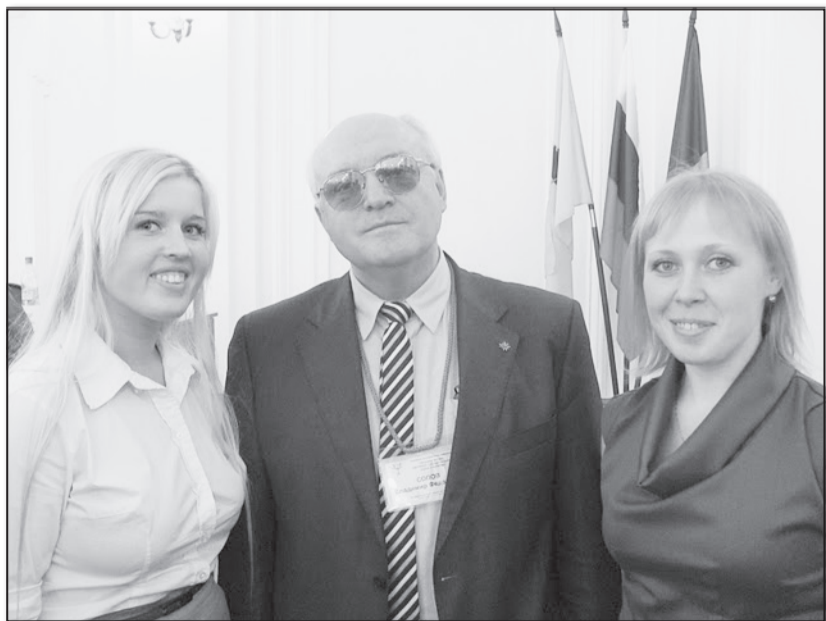
Студенты-психологи с известным спортивным психологом Владимиром Соповым