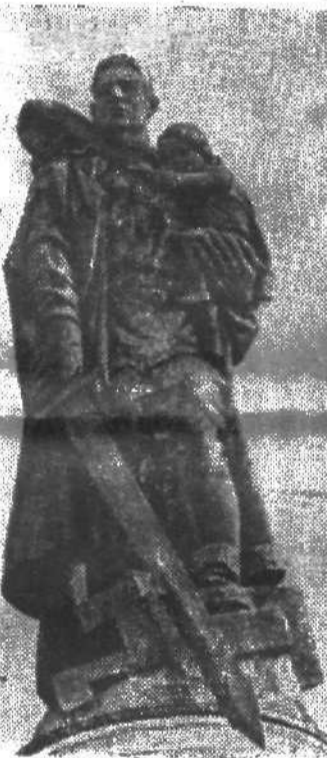
Павшим героям забвения нет: Смелый живет всегда! Звезда угасает, но тысячи лет Свет свой струит звезда.

Несмотря на обилие литературы о Великой Отечественной войне, многие ее страницы так и не получили должного, правдивого освещения. Объясняется это, как мне представляется, комплекснейшим, нередко конъюнктурным подходом к изучению истории войны. Одно время, например, увлеклись выяснением «онопыной правды», но кому-то она показалась чересчур жуткой и не патриотичной, и ее оставили. Некоторые историки и журналисты вдруг принялись дискутировать о том, что если бы войска пошли бы не так, а как-то по-другому, то и потерь было бы меньше, и победа была бы ближе. Неправданным было возвышение отдельных политработников, ставших потом государственными деятелями, а так же забвение популярных среди солдат полководцев и возникшая неслучайно мода на «малую землю». Сейчас в связи с известными событиями в Восточной Европе похоже муссируются разговоры о том, нужен ли было освободить эти страны? Не была ли заложена в этой освободительной миссии мина замедленного действия, вымывавшая наше последующее отставание? Не потому ли, глядя на пустые полки наших магазинов некоторые начинают задумываться: победители мы или побежденные? Все это больно отзывается в сердцах бывших воинов.