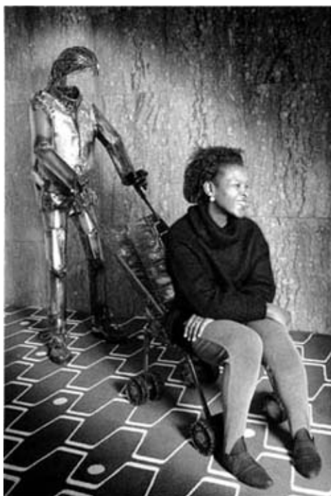
Кэмп Сокари Дуглас