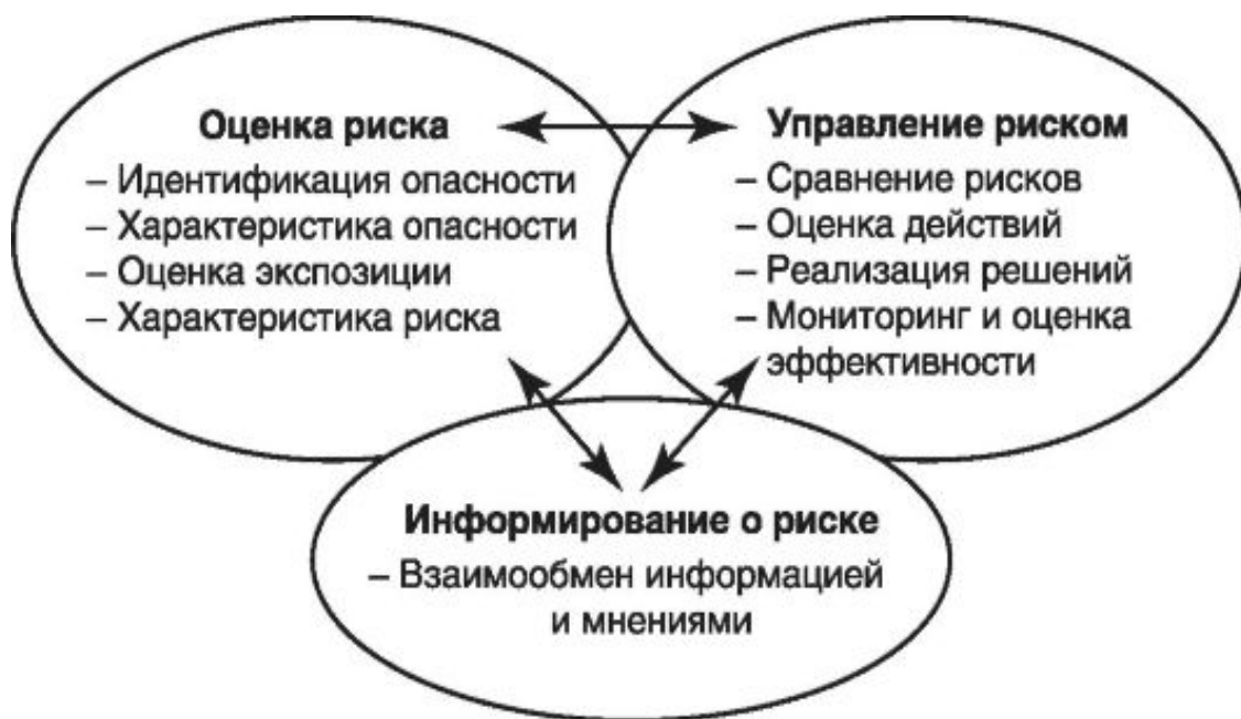
Рис. 1. Схема взаимосвязей этапов анализа и управления риском здоровью

На рис. 1 представлена общая схема оценки риска, управления им и процесса информирования о риске в их взаимосвязях.