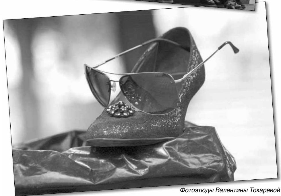
Фотоотюды Валентины Токаревой