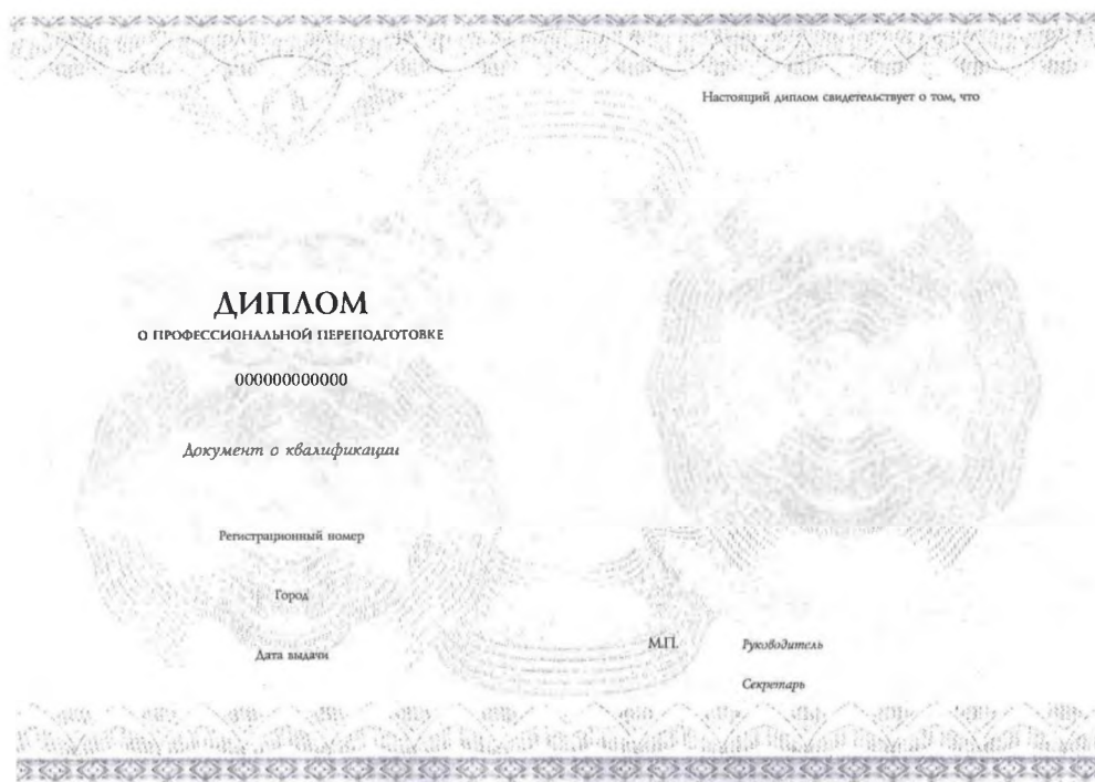
Рис. Б4 – Обрат титульного листа бланка диплома о профессиональной переподготовке