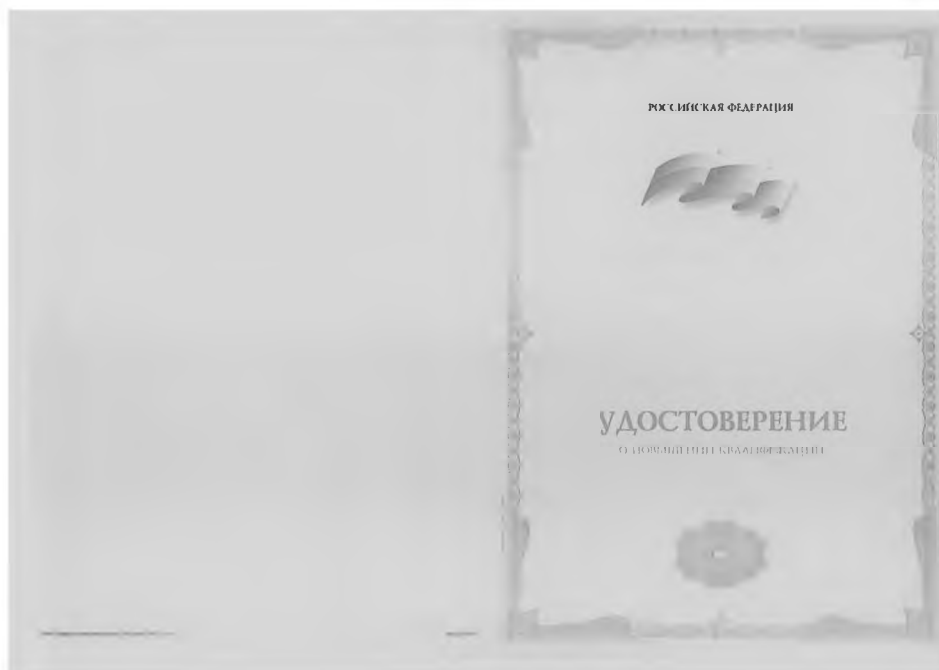
Рис. Б1 – Титульный лист бланка удостоверения о повышении квалификации