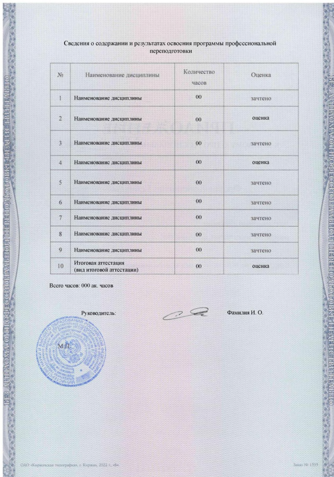
Рис. Ж2 – Образец заполнения бланка приложения к диплому о профессиональной переподготовке с присвоением квалификации страница 2, (формат А4)