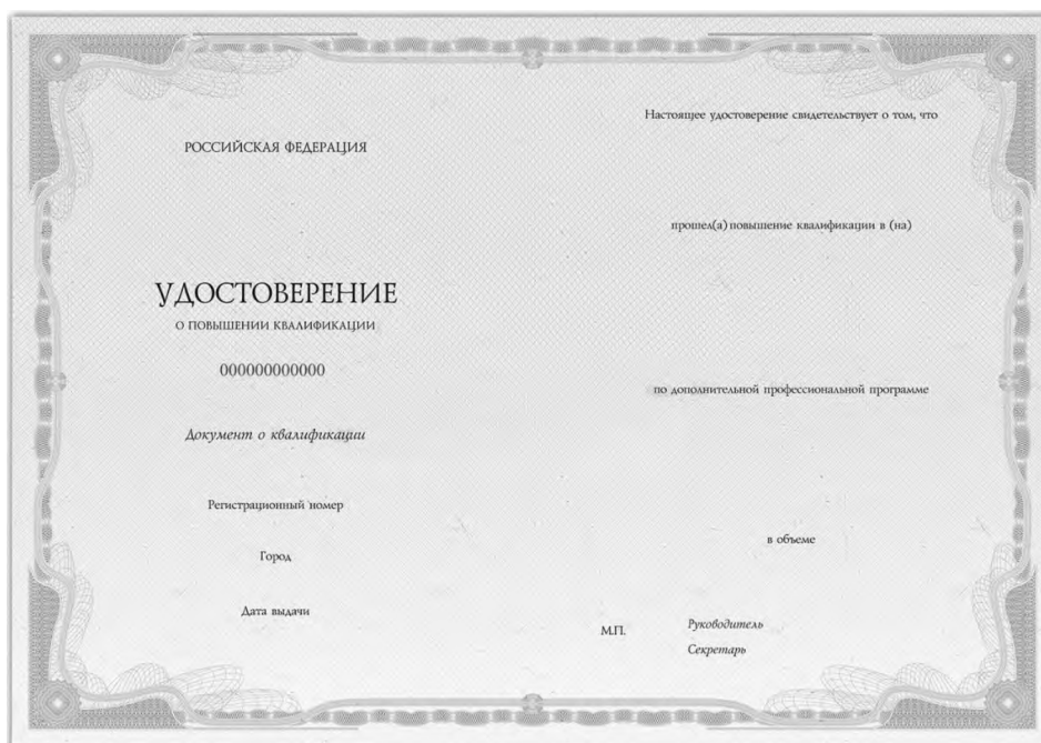
Рис. Б2 – Обрат титульного листа бланка удостоверения о повышении квалификации