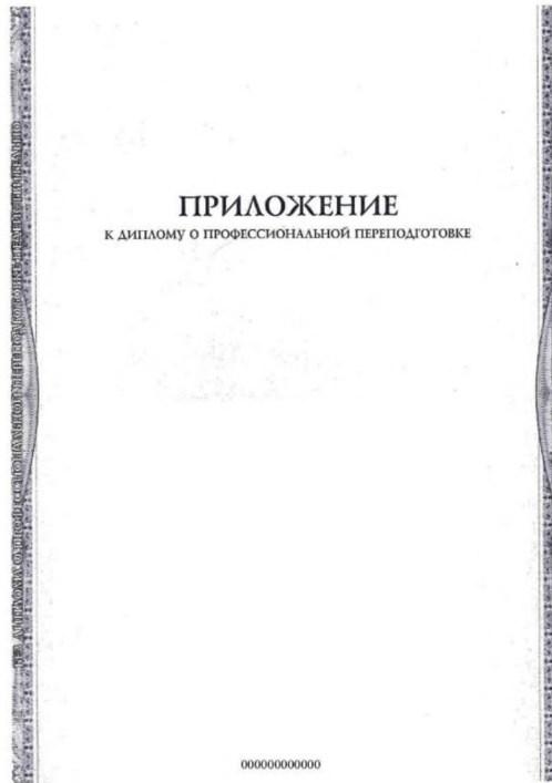
Рис.Б5 – Бланк приложения к диплому о профессиональной переподготовке страница 1, (формат А4)

Бланк приложения к диплому о профессиональной переподготовке