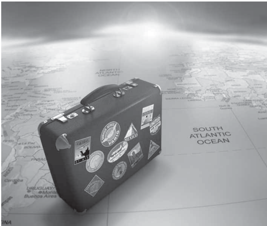
Главное, чтобы планы были у туроператоров, которые помогут определить точное направление и дадут несколько ценных советов