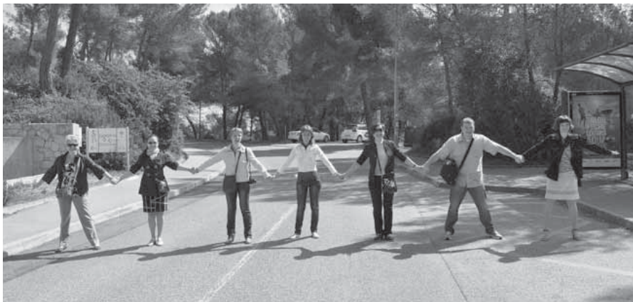
Остановить автобус, чтобы выбраться из «Антигорода», оказалось непросто: инновационный подход сотрудников УНИ