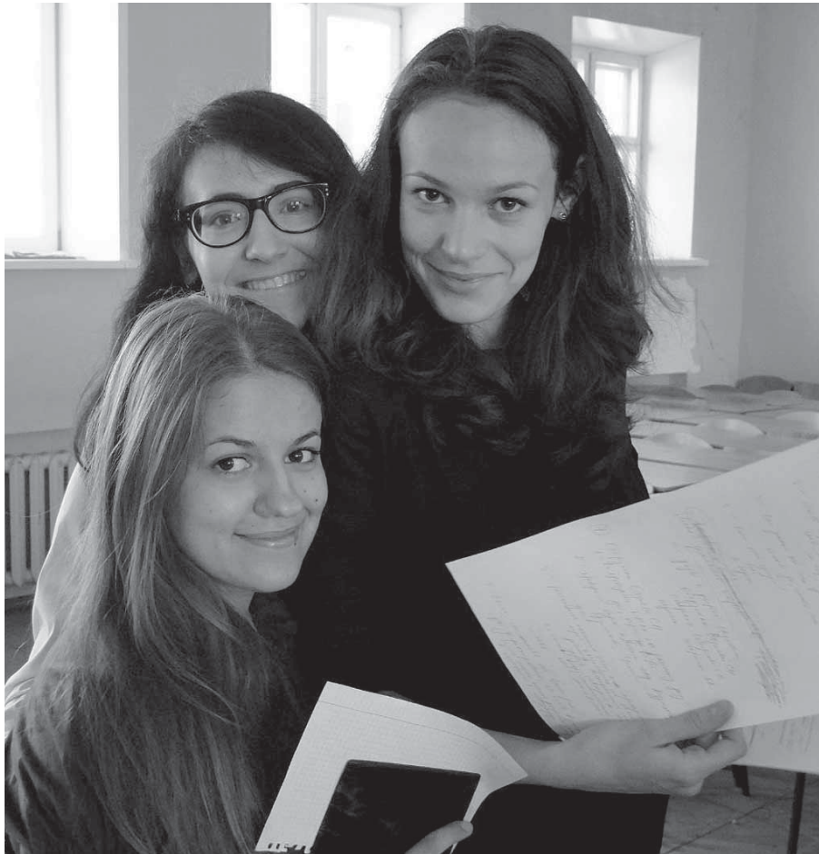
Участники студенческого научного актива юрфака

К очевидным достоинствам проведенного мероприятия следует отнести свободную дискуссию по вынесенным на обсуждение вопросам, изложение проблем с точки зрения последних мировых событий и новых законодательных инициатив, формулирование студентами позитивных предложений по реформированию отечественного законодательства с учетом российского опыта, доктринальных разработок, наблюдаемых тенденций развития государственной политики.