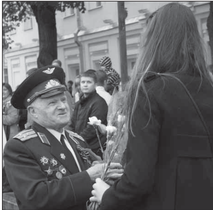
Спасибо ветеранам. Полный архив фотографий вы можете посмотреть в группе «Университетской газеты» Вконтакте http://vk.com/uniyar_gazeta_g

День. Дождь. Наши фотографы побывали на Воинском мемориальном кладбище и у Вечного огня, где прошло возложение цветов к могилам павших. Среди множества присутствующих и молодежь, и ярославцы старшего возраста. И, конечно же, – ветераны. Минутой молчания почтили память павших. Первые лица города произнесли слова благодарности в адрес ветеранов. Военные отдадут честь, кадеты преклоняют колено. Некоторые молятся.