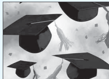
График вручения дипломов ЯрГУ