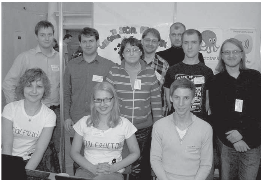
Ярославская делегация на конференции FRUCT

Конференция FRUCT позволила студентам, аспирантам и преподавателям факультета ИВТ выступить с докладами перед специалистами в области ИТ, получить ценные советы, найти поддержку