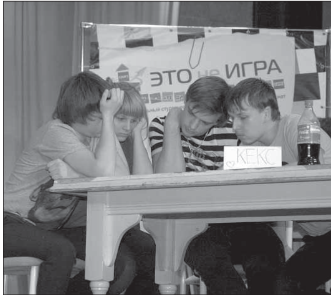
КЕКСы в раздумьях

нес-кейсов и бизнес-задач. Иногда задания приходили в час ночи и к трём часам следующего дня, и мы должны были предоставить полноценный ответ с грамотным и лаконичным решением поставленной задачи.