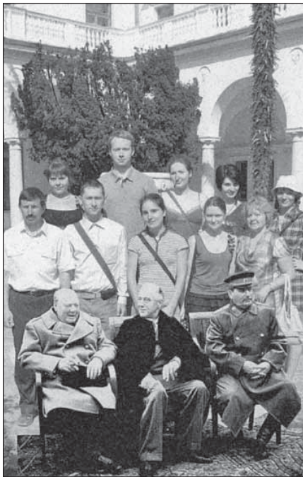
Ялта. «Погружение» в историю удалось...